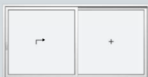
Schéma A un vitrage fixe et un ouvrant levant coulissant