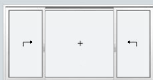
Schéma K un vitrage fixe et deux ouvrants levants coulissants