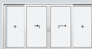
Schéma C deux vitrages fixes et deux ouvrants levants coulissants

76 mm PremiDoor Lux : un châssis réduit autour d'un vitrage fixe.