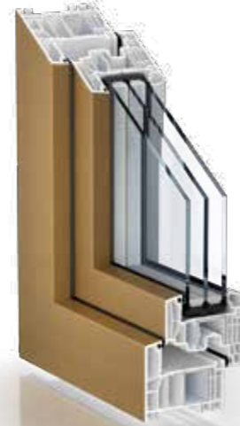
FOLIERT IN METALLIC- OPTIK