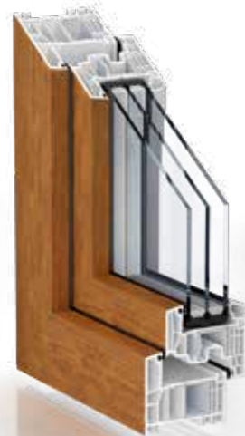
FOLIERT IN HOLZSTRUKTUR