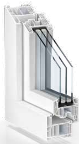
KLASSISCH PVC WEISS

Dank des eleganten, minimalistischen Designs ist das Fenster- und Türsystem sowohl in historischen als auch in modernen Gebäuden an der richtigen Stelle. Dabei können Sie in Farben und Oberflächen schwelgen, von klassischem PVC Weiß und plakativen Bunttönen über Metallic-Nuancen bis hin zu Holzstrukturen. Je nach Vorliebe bleiben die Kunststoff-Profile innen neutral weiß oder werden beidseitig foliert. Praktischer Zusatznutzen: Die Oberflächen sind äußerst langlebig und leicht zu reinigen.