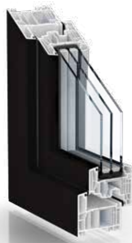
FOLIERT IN UNIFARBEN