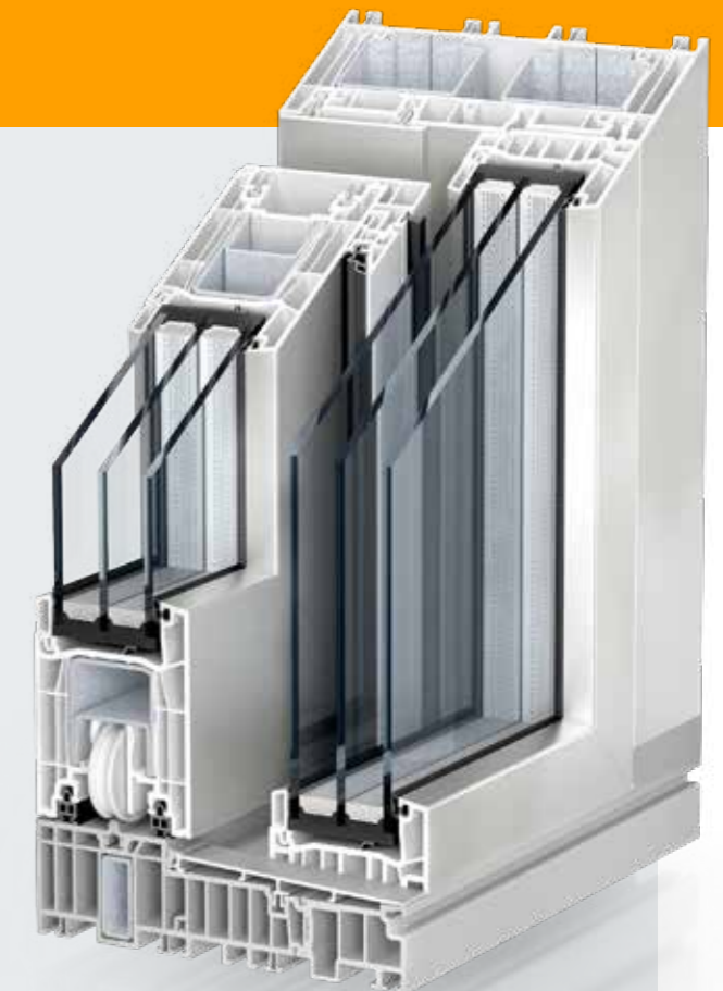
PremiDoor 76 LUX